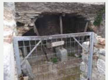
再向前走不遠，便是荒廢了的監牢。其中一個有「這是保羅的監牢」。

就讓眾華人教會向腓立比教會借鑑學習，愛人愛神，建立合神心意的教會，在傳福音及差傳努力不懈，投資永恆，將榮耀歸給天上的父神！