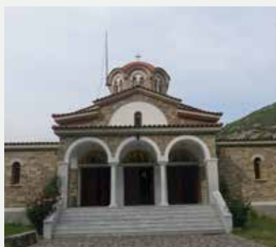
腓立比城外郊的小河旁，坐落了腓立比教會。

腓立比教會是歐洲的第一個教會，是保羅第二次出外佈道時，回應馬其頓異象來到腓立比所建立的(徒16:12-40)。腓立比教會與保羅關係密切，常有書信來往。腓立比書可以說是保羅書信中最親切、溫馨及富人情味的一封。為什麼保羅對腓立比教會有這濃厚感情呢？簡單來說，因為腓立比教會是富有愛心的教會、是差傳的教會，是一間合神心意的教會！