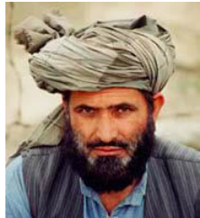
阿富汗的普什圖人，南部

國家：阿富汗 民族：Pashtun, Northern 人口：6,508,000 世界人口數：43,259,000 主體語言：Pashto, Northern 主要的信仰：伊斯蘭教 聖經：完整 狀況：福音荒涼的族類 信主的人：少於 2%