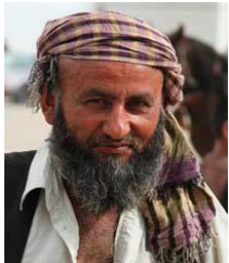
阿富汗的普什圖人，北部

國家：阿富汗 民族：Pashtun, Northern 人口：6,508,000 世界人口數：43,259,000 主體語言：Pashto, Northern 主要的信仰：伊斯蘭教 聖經：完整 狀況：福音荒涼的族類 信主的人：少於 2%