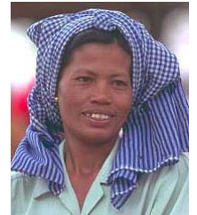
柬埔寨的高棉族，中部

國家：孟加拉國 民族：Shaikh 人口：136,324,000 世界人口數：229,702,000 主體語言：Bengali 主要的信仰：伊斯蘭教 聖經：完整 狀況：福音荒涼的族類 信主的人：少於 2%