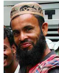
孟加拉國的謝赫人

國家：阿爾及利亞 民族：Algerian, Arabic-speaking 人口：26,315,000 世界人口數：34,085,000 主體語言：Arabic, Algerian Spoken 主要的信仰：伊斯蘭教 聖經：新約 狀況：福音荒涼的族類 信主的人：少於 2%