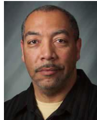
阿爾及利亞的阿爾及利亞阿拉伯人

國家：阿富汗 民族：Pashtun, Southern 人口：6,855,000 世界人口數：9,250,000 主體語言：Pashto, Southern 主要的信仰：伊斯蘭教 聖經：部分 狀況：福音荒涼的族類 信主的人：少於 2%