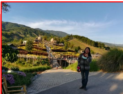
攝于 Roi Cai Rak 花园