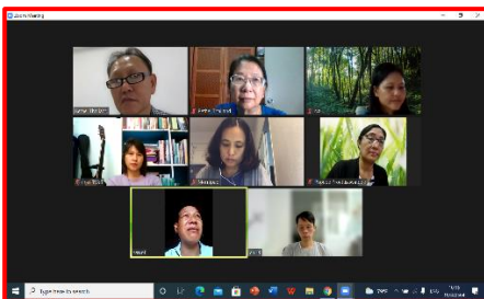
七位老師同工網上面試學生

神學院服事分享 神學院的教導仍採用網路教學，感謝神！師生們也適應得越來越好。學生的學業方面有進步，但他們的屬靈生命方面，欠缺有系統的集體生活操練，到底成長多少就無法測量，也是作為老師的我們感到無力及牽掛的地方。此外，因教會沒有實體聚會，學生就無法回到教會實習，受影響最大的是明年三月開始，就要全時間實習十一個月的三年級學生，仍在等候實習教會的回覆。懇請為學生們的屬靈生命成長，和教會實習的需要禱告，好嗎？