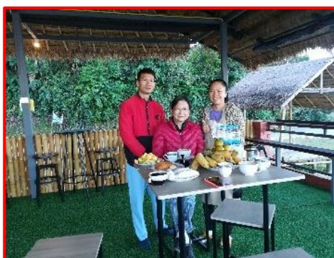
在塔和梅的咖啡店吃早餐