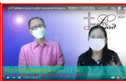
作講臺翻譯(泰翻中)