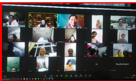
帶領姐妹小組查經