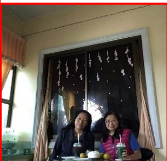
与莉莉傳道用上午茶