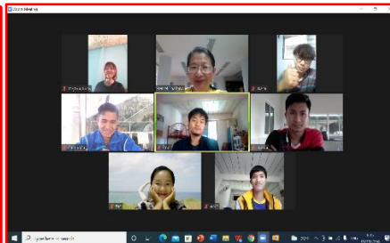
網路教學（一年級學生）