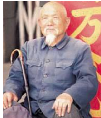
中国的 汉族 (湘)