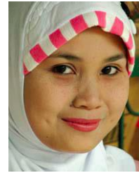
印度尼西亞的巽他人

國家：印度尼西亞, 印尼 民族：Java Pesisir Lor 人口：36,069,000 世界人口數：36,069,000 主體語言：Javanese 主要的信仰：伊斯蘭教 聖經：完整 受狀況：福音荒涼的族類 信主的人：少於 2%