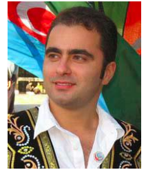
伊朗說土耳其語的阿塞拜疆人

國家：印度尼西亞, 印尼 民族：Sunda 人口：36,705,000 世界人口數：36,705,000 主體語言：Sunda 主要的信仰：伊斯蘭教 聖經：完整 受狀況：福音荒涼的族類 信主的人：少於 2%