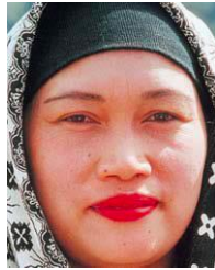
印度尼西亞的爪哇族 (中部爪哇語)

國家：印度 民族：Yadav (Hindu traditions) 人口：60,600,000 世界人口數：61,872,000 主體語言：Hindi 主要的信仰：印度教 聖經：完整 受狀況：福音荒涼的族類 信主的人：少於 2%